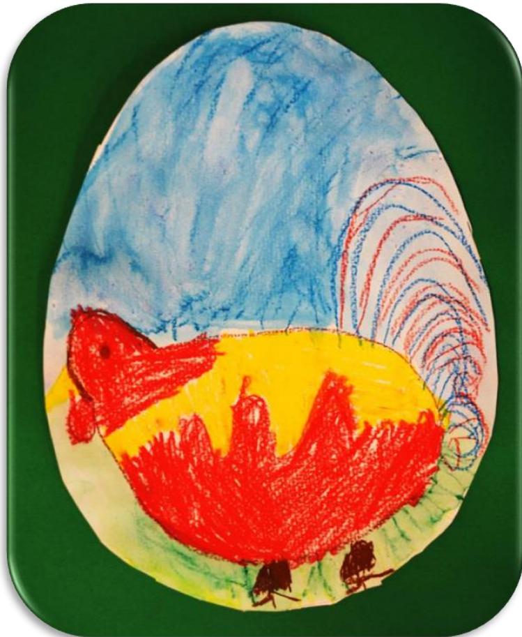
Kilian Held Kindergarten